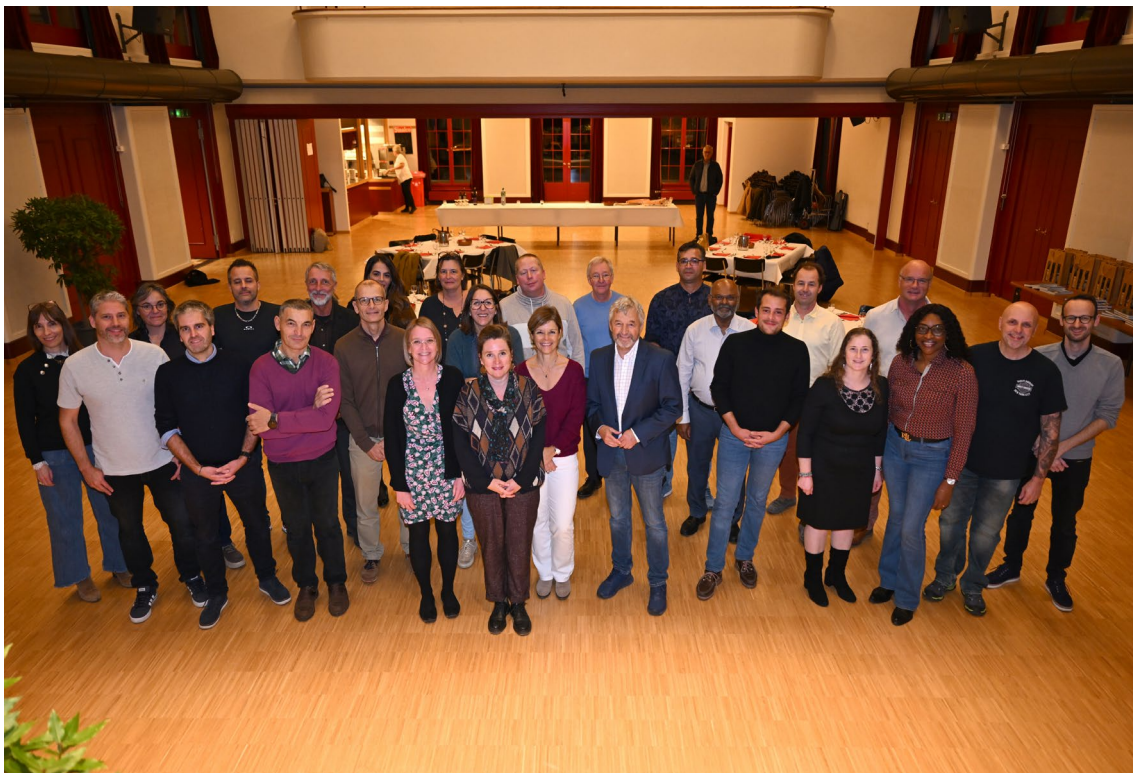
7 novembre 2022

Lundi soir, la Municipalité a tenu à honorer les jubilaires de l'Administration communale. Cette soirée, qui s'est déroulée à la Salle communale, a été l'occasion pour la Municipalité de partager un moment de convivialité avec les collaboratrices et collaborateurs concernés, de les remercier de leur fidélité, ainsi que de les féliciter chaleureusement pour leur engagement.