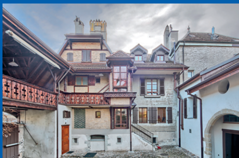
Maison Falconnier à Rive

chateaudenyon.ch , mrn.ch , mueedulman.ch