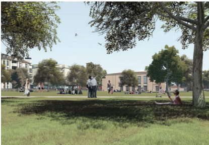
Projection de la future place Perdtemps

La place Perdtemps sera bientôt rendue aux Nyonnais-es. Elle offrira dans sa nouvelle version un parc végétalisé, un parking souterrain, des commerces et des locaux publics, en plus de logements. Participez au projet comme experts-usagers et aidez les équipes de concepteurs à imaginer et à