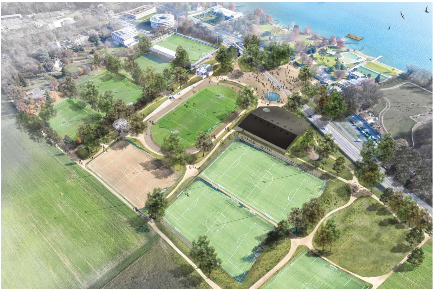
Localarchitecture, P. Heyraud, Inghip SA, Enege Sarl et Citec

Les futures installations de Colovray enrichiront considérablement l'offre nyonnaise en matière de sport et de loisirs pour toutes et tous. Un projet ambitieux qui se concrétisera dès 2022.