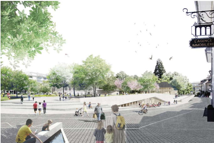
L'entrée côté porte de Saint-Jean.