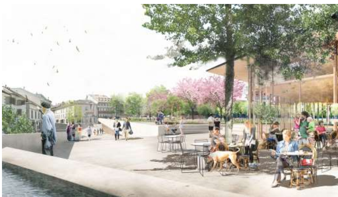
Vue depuis la future médiathèque-bibliothèque-ludothèque.