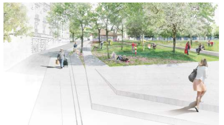
Angle avenue Viollier-rue St-Jean.

En se parant de vert, Perdtemps deviendra un grand parc urbain en pleine terre bordé de jardins thématiques avec, en son centre, un grand pré et des terrains de pétanques, des potagers urbain, des jardins partagés et des aires de délasserment.