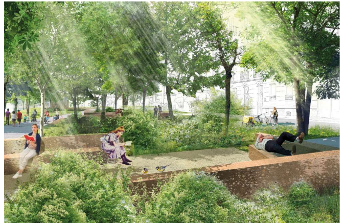
L'angle avenue Perdtemps-rue des Marchandises.

La Municipalité a la volonté de réaliser rapidement le parc Perdtemps: dès 2021, elle entend engager les travaux de construction du parking souterrain. Durant les travaux, la majeure partie du parking existant en surface sera maintenu, et celui des Marchandises sera ouvert au public. Une fois ces travaux achevés,