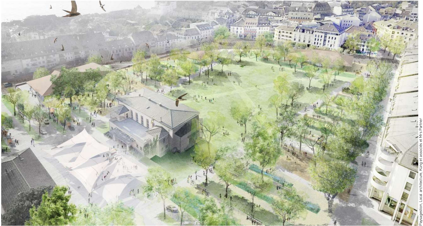
Au premier plan, la Salle communale.